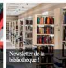
Newsletter de la bibliothèque !