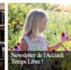
Newsletter de l'Accueil Temps Libre !