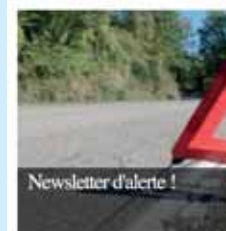
Newsletter d'alerte !